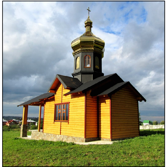
На новому москалівському цвинтарі греко-католицької громади урочисто освячено і відкрито нову капличку, зведену у традиційному народному гуцульському стилі.

Україна стала європейським аутсайдером за кількістю людей, які читають книги. В країні через відсутність моди на освіченість, застарілі бібліотеки і високі ціни зникла традиція читання, а значить, під загрозою вміння нації критично мислити і творчо обробляти інформацію.