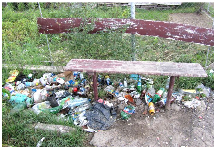
Звична картина? Чому? Поряд же магазин на вулиці Ірчана

Номер «телефону гарячої лінії»: (0342) 75 24 21