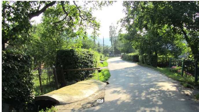
фото). Власники будинку не придумали нічого кращого, ніж збудувати величезний бетонний місток, який на півметра виліз

на дорогу, створивши небезпечну ситуацію для транспорту.