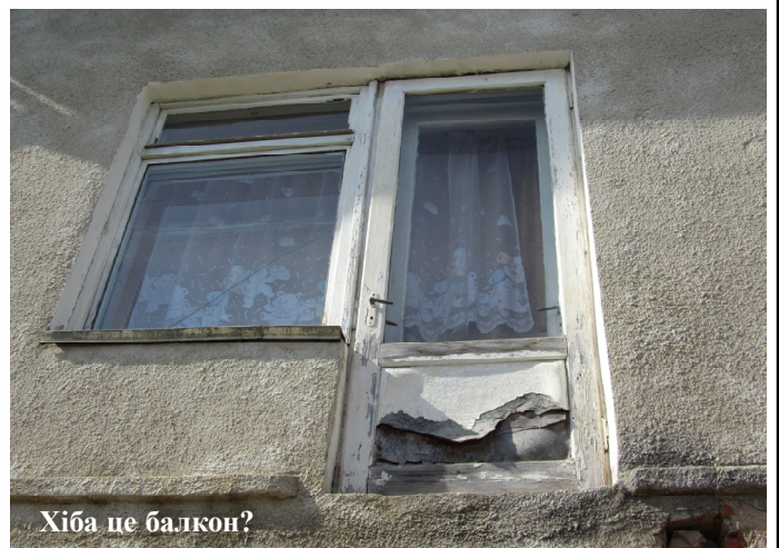
Хіба це балкон?