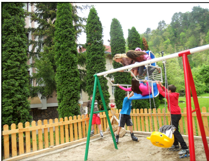
Як довго витримають нові качелі у центрі Косова отакій нестримний натиск нечемних підлітків?