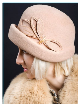
На світлинах: демонстрація жіночих головних уборів від «Вишуканості»